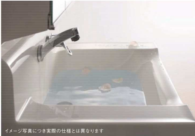
イメージ写真につき実際の仕様とは異なります

日々くりかえされる、何気ない時間 ゆっくりと「毎日」が綴られていきます。 そうした毎日の暮らしの中に 幸せはつまっています。